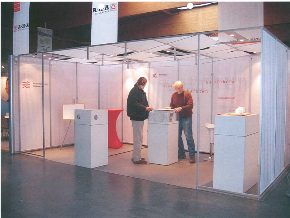
Aufbau des Messestandes

Das Projekt ROSH, das seinen Messestand wieder mit der Architektenkammer Niedersachsen präsentierte, war in der Halle 4, in der auch die Vorträge stattfanden, gut platziert. Die target GmbH hatte sich für diese Messe Unterstützung aus den Architektenreihen organisiert. Örtlich aktive Energieberater, die besonders in dem Feld der Mehrfamilienhaus-Sanierung tätig sind, standen für die Fragen der Messebesucher bereit.