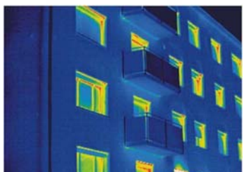
Термография преди и след санитарнето: колкото повече е синият цвят, -