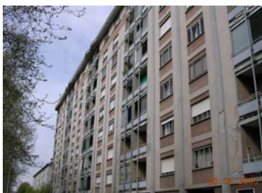
Via Adamello, Италия