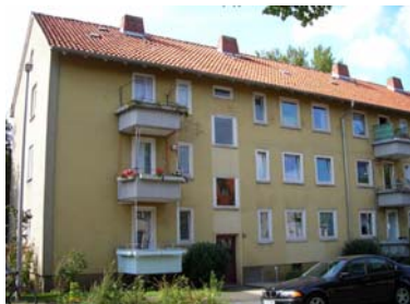
Beuthener Straße, Германия