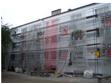
Sambora Street, Полша