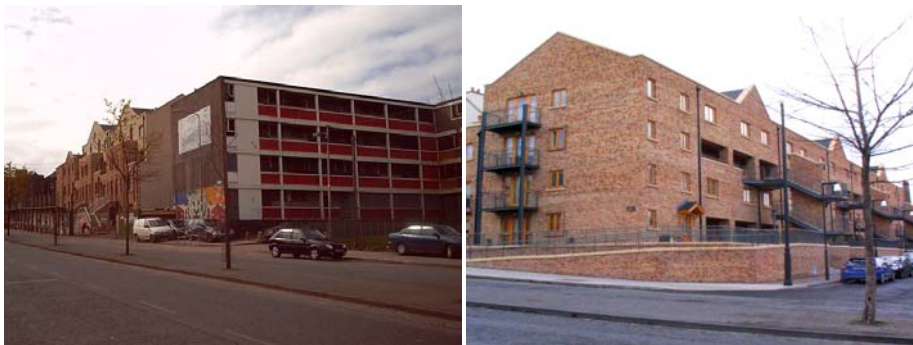
Bridgefoot Street – преди и след санитарнето

Жилищната сграда на Bridgefoot Street е построена през 1964г. и санитарна през 2001г. Има общо 32 апартамента, а приложените енергоспестяващи мерки включват подмяна на отоплителната система, пълна промяна на обвивката на сградата, включително подмяна на прозорците.