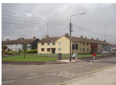
Bunratty Road, Ирландия

Трите основни показатели за фазата на мониторинг на всички демонстрационни проекти ще са доставената енергия kWh/m 2 /yr (средно), CO 2 /m 2 /yr (средно) и цена на енергията за апартамент. Други показатели могат да бъдат: тест за инфилтрация на сградата, термовизионни снимки, въпросници към обитателите на сградите, сравнение на планираните и реално постигнатите икономии, измерване на температура и влажност.