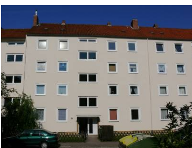
Демонстрационен проект “Euler Street” в Хановер