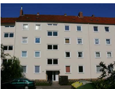
Demonstrationsprojekt Eulerstraße, Hannover