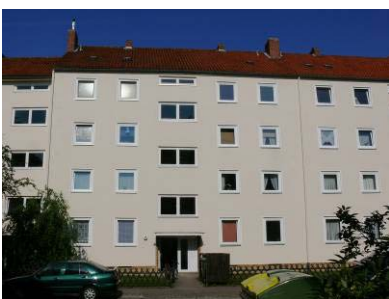
Progetto dimostrativo Euler Strasse, Hannover