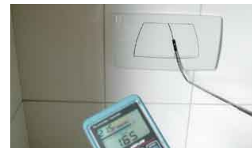
Приток на външен въздух през бутона на тоалетното казанче