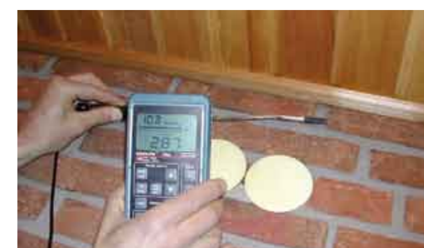
Приток на външен въздух със скорост 2.9 m/s през стена на помещение