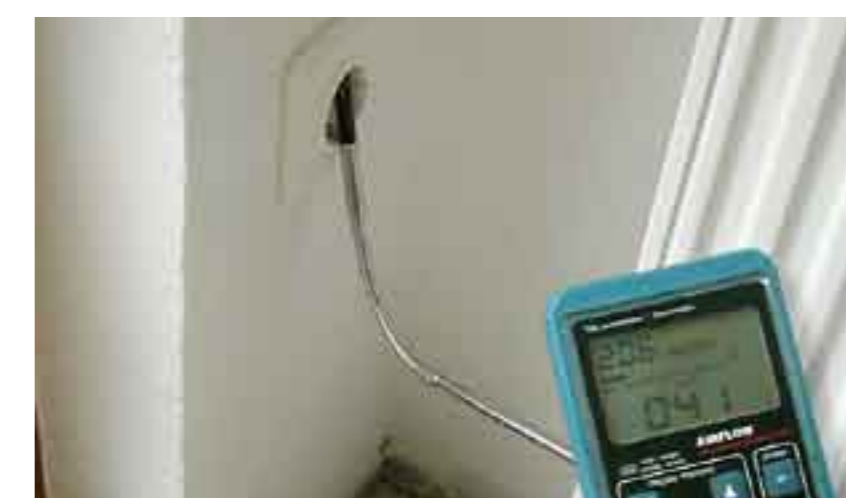
Приток на външен въздух през ел. контакт