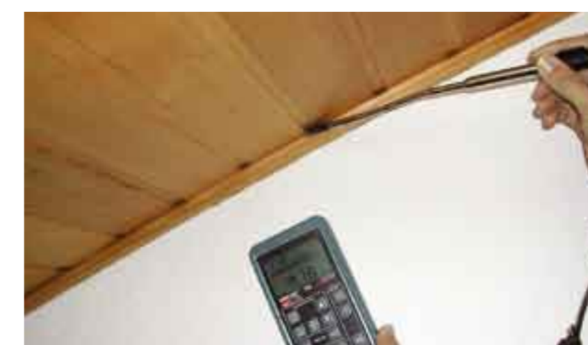
Приток на външен въздух със скорост 9 m/s през стена с фронтон