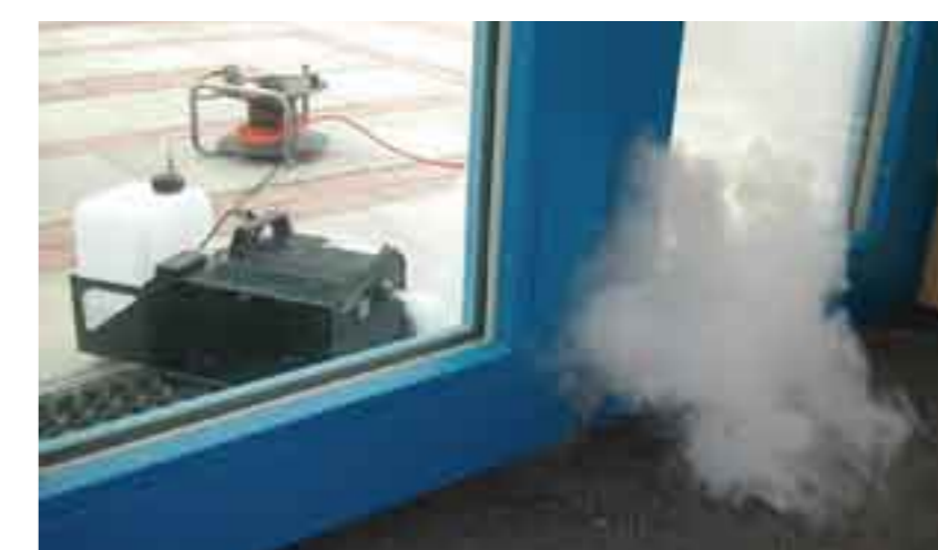
Визуализиране на пропуски чрез дим